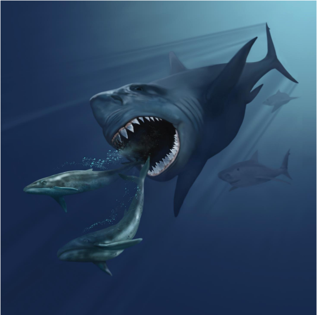
A megalodon hunting primeval whales

Megalodons are an extinct species of sharks. They grew up to 15 m in length.